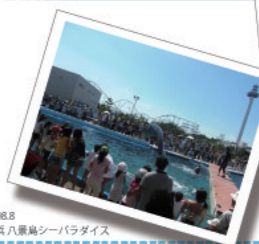
2008.8 横浜 八景島シーパラダイス