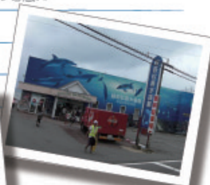
2010.8 福井 越前松島水族館

*ライフア西のホームページにも 店長ブログ「店長の独り言」 随時UPしていますので覗いてみてください！！