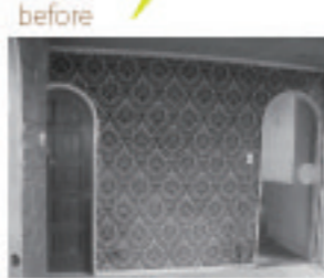
消臭・調湿効果のある エコカラットはリビングの 壁のアクセントとしても おしゃれです。