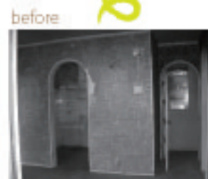
既存のアーチ型ドアと ストライプの柄クロスが とてもマッチして さわやかな印象のお部屋へ。