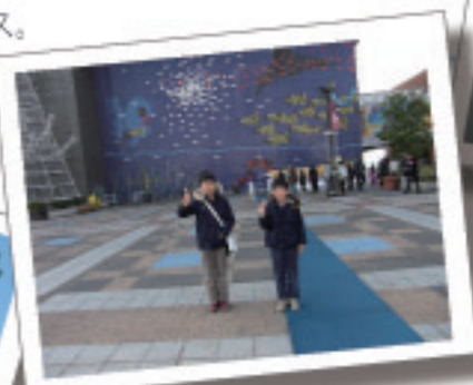
2010.1 大阪 海遊館